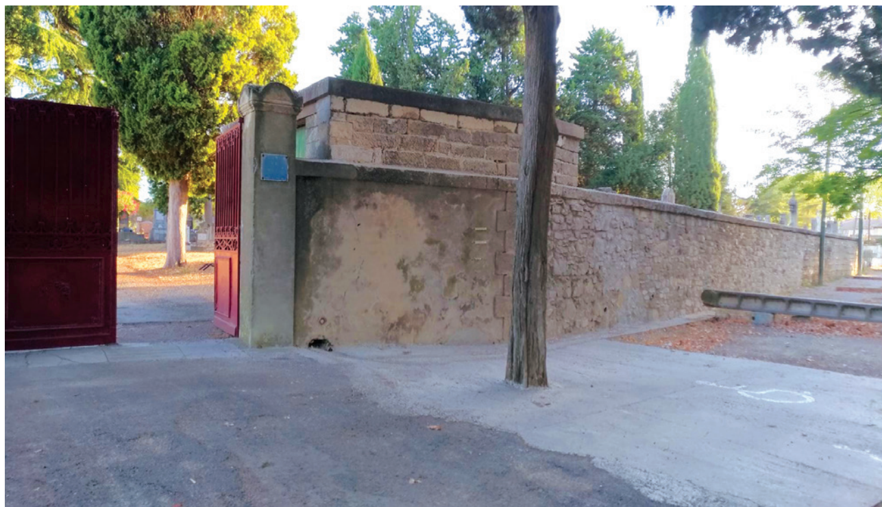
Mur de clôture du cimetière

- Le mur de clôture du cimetière (côté boulodrome) a été consolidé, et le portail repeint.