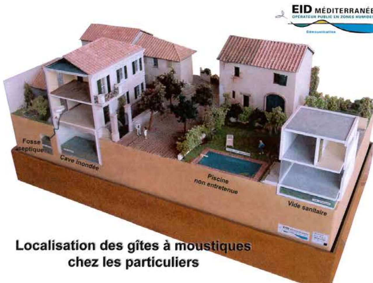
Localisation des gîtes à moustiques chez les particuliers

«Allo, j'écoute...» : l'EID Méditerranée au service du public ( www.eid-med.org ) n° Indigo 0 825 399 110 (0,15 € T.T.C./mn).